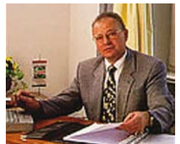
Edgar Schall GmbH