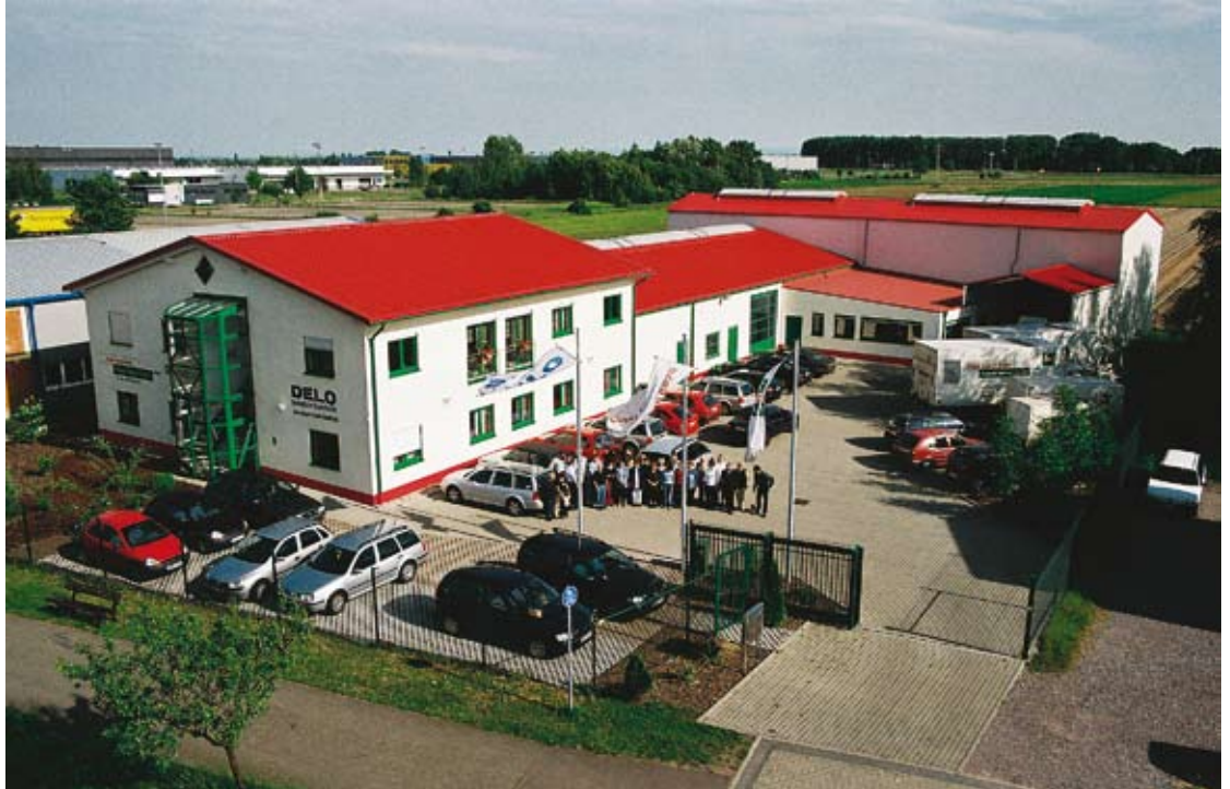
Edgar Schall GmbH

Der Vertrieb von Castrol Schmierstoffen und DELO Industrieklebstoffen sind das Kerngeschäft der Edgar Schall GmbH aus Offenbach. Als offizieller „Castrol Service Center Südwest“ und DELO Stützpunkthändler verfügt Schall über einen eigenen Lager von Schmier- & Klebstoffen und beliefert Kunden aus ganz Südwestdeutschland mit dem hauseigenem Fuhrpark und Paketdienst. Im Jahr 1991 als Handelsvertretung gegründet, beschäftigt die heutige GmbH durchschnittlich ca. 60 Mitarbeiter, davon 30 festangestellt und 30 als Aushilfskräfte.